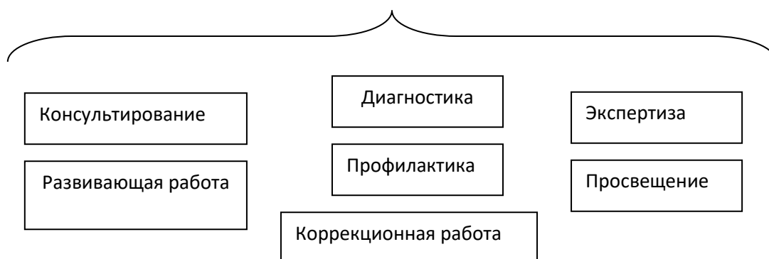
Основные направления психолого-педагогического сопровождения